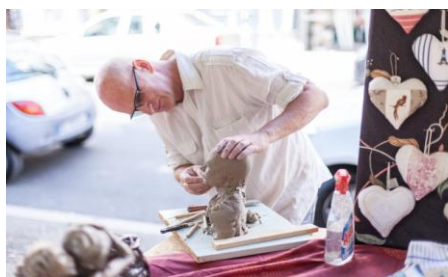
Démonstration de sculpture à Vichy