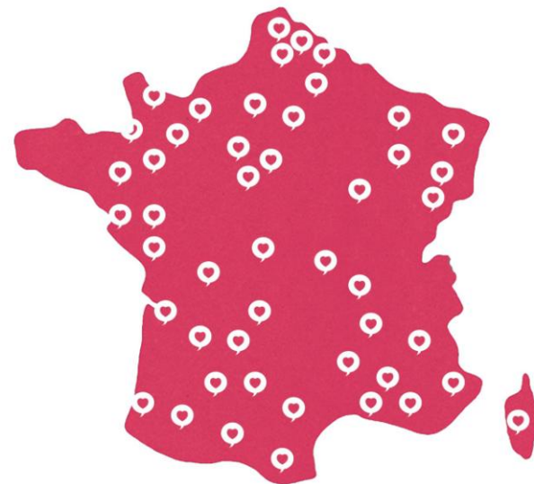
La carte des évènements « Journées du Fait Main » en 2015.