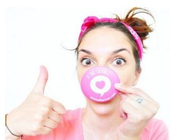
Une créatrice heureuse à Orange